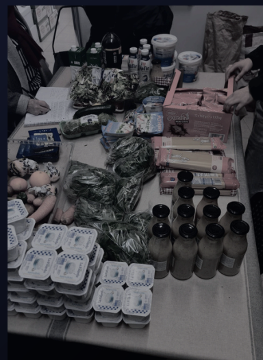
→ Entrega de alimentos