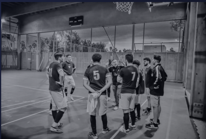
→ Equipo de Fútbol Pa dels Pobres