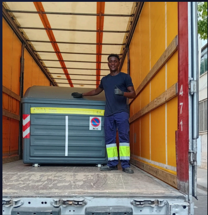
→ O.K. en su primer día de trabajo