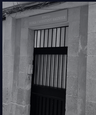
→ Edificio Núria Cavestany Sagnier