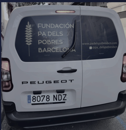
→ Furgoneta de la Fundación